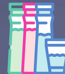
Colorant alimentară lichid