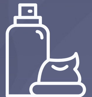
Spumă de ras