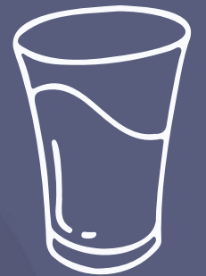
Un pahar plin cu apă